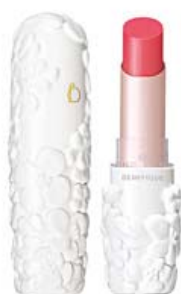
リップスティック (メルティタッチ)