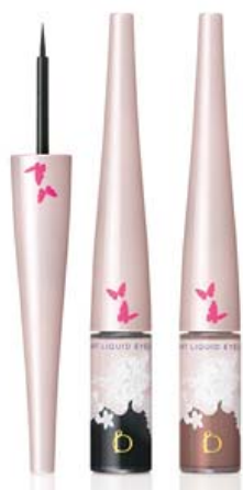
スマートリキッドアイライナー

2014年春夏は、リニューアル1周年を記念して「愛され瞳」を実現する数量限定品の「スマートリキッドアイライナー」と、「リップスティック (メルティタッチ)」の新色を発売します。